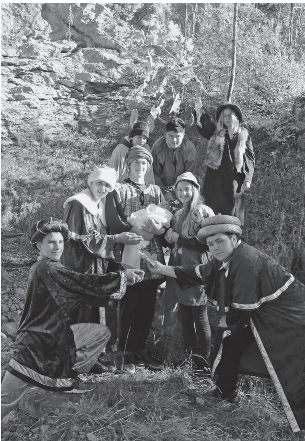
Konfirmationsklasse Kreis I + IV Langnau und Trubschachen

Gerade an Weihnachten wird uns immer wieder neu bewusst, dass wir nicht bloss Zuschauer, sondern auch TeilhaberInnen am Geschehen von Weihnachten sind und unsere Freiheit in Christus, in einem kleinen Kind, in einem unscheinbaren Stall in Bethlehem finden. Freiheit – ein kostbares Weihnachtsgeschenk!